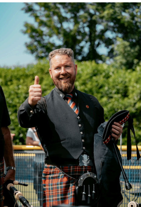
< HAMPSHIRE CALEDONIAN (ANGLETERRE) POUR LE MEILLEUR DRUM CORPS