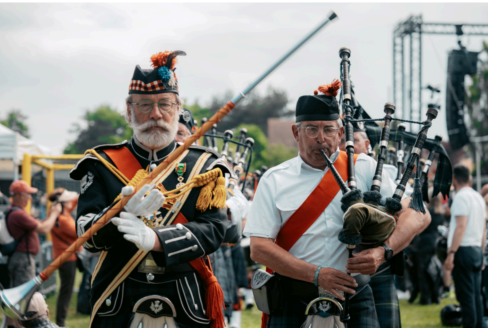
Le Samarbriva Pipes & Drums Band lors de son passage sur la D-Day Normandy Cup

Plus de 7000 visiteurs ont été au rendez-vous tout au long de cette première édition, qui a enchanté les festivaliers amateurs de musique celtique (dont de très nombreux militaires), mais aussi de l'ensemble des partenaires et exposants.