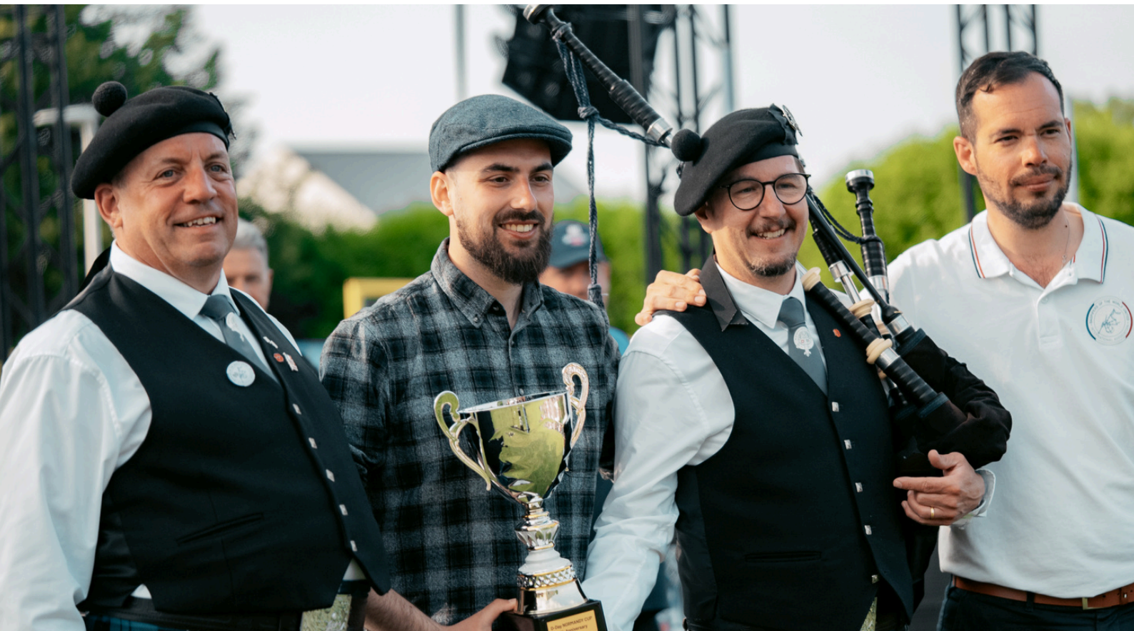
^ 3 LAKES UNITED (SUISSE) DANS LA CATÉGORIE PIPE BAND

Félicitations aux gagnants des différents concours :